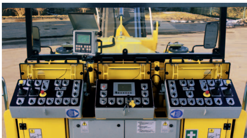
Интуитивная концепция управления.