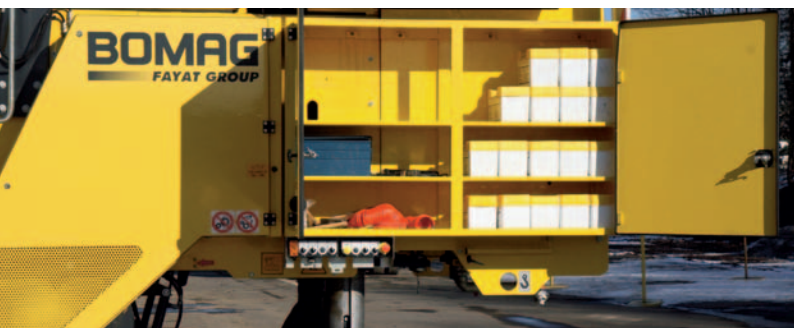
Большие отсеки для принадлежностей.