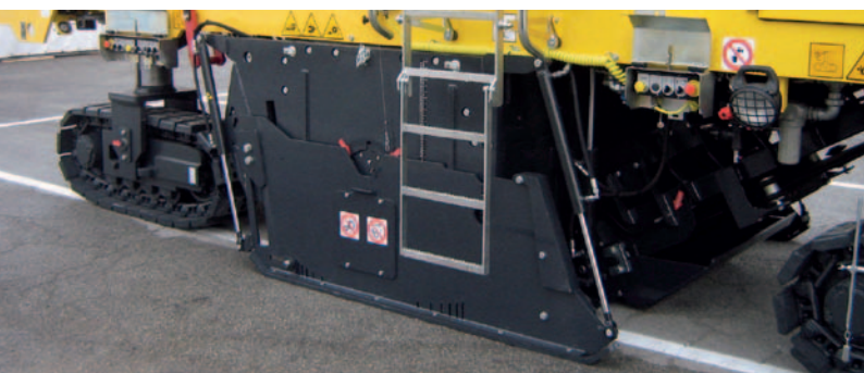
Гидравлические боковые щиты.

Комфорт и безопасность. Новые отсеки большой вместимостью послужат вам в качестве дополнительного “багажника” для быстроизнашиваемых деталей, инструмента и личных вещей, доступ к которым возможен с земли.