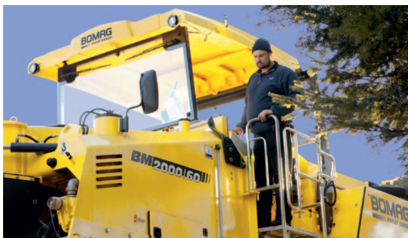
Препятствия? Просто сместитесь в сторону.